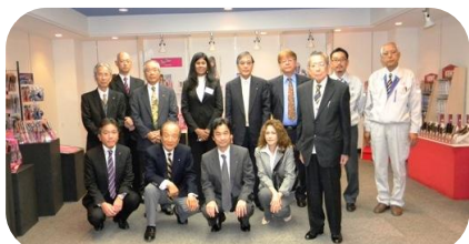
シャマリさんを中心に、説明役の池本刷子工業（株）の社員も含めて全員で記念撮影