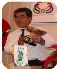
グレン&千杯第8回ロータリー選抜野球大会 結果速報